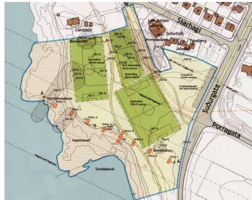
Deiliskipulag Starhaga – aðflugsljós fyrir Reykjavíkurlugvöll